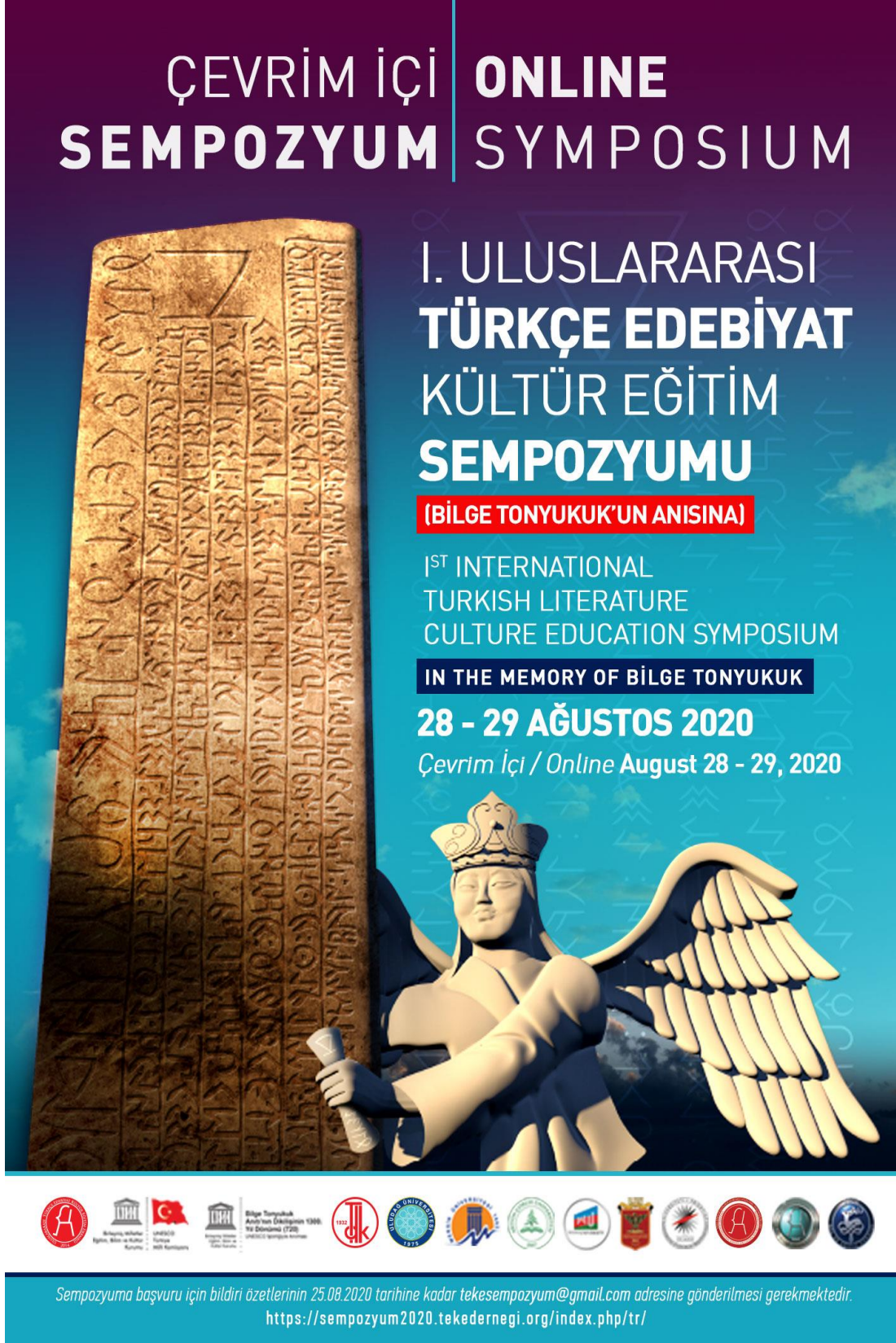
Foto 1: I. Uluslararası Türkçe Edebiyat Kültür Eğitim Sempozyumu'nun afişi (Görsel: Levent ALYAP - Grafik Tasarımı: M. Fatih KILIÇ)